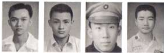
郭明周 生廣陸 山立王 堅本林

Handwritten signature or calligraphy in the bottom left corner.