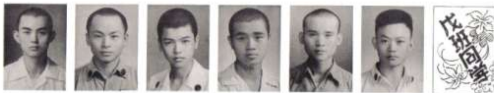
一志呂 儀學昇 唯美吳 賢龍昇 光強甘 平一王