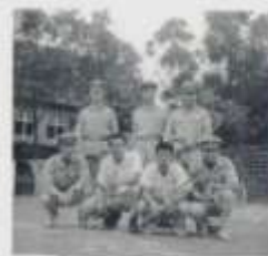
歐特中學的排球球隊