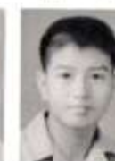
明 傳 江