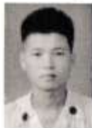
成 錫 村