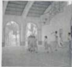
萬吉村籃球場開光典禮