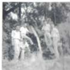
區 區 地 學