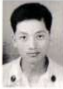
羅 北 陸