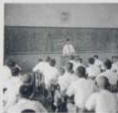
委重担担林林法文