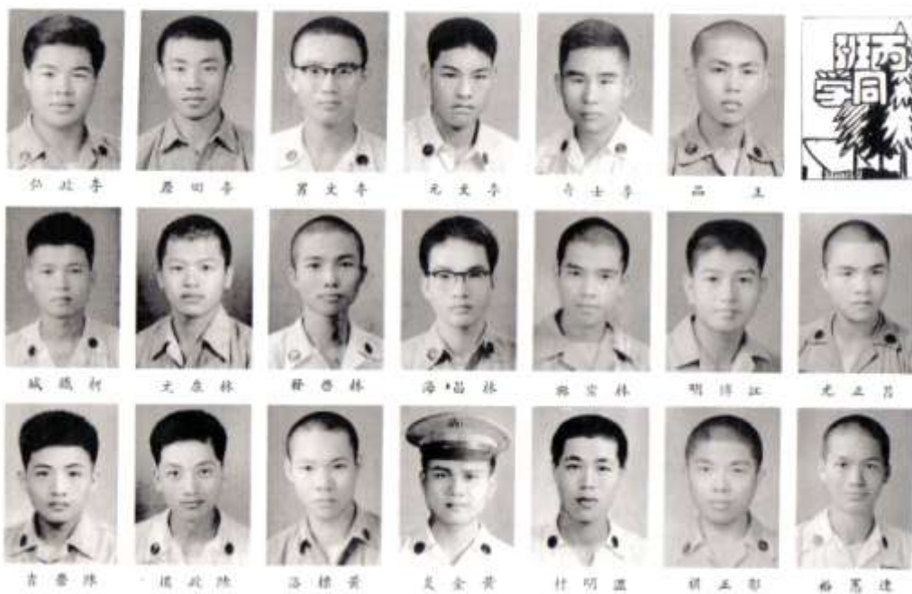
仙 廷 亭