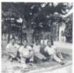
心丹其百，想小無德