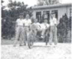
史 奉 心 童