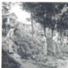
波得恩珍，園仗明整