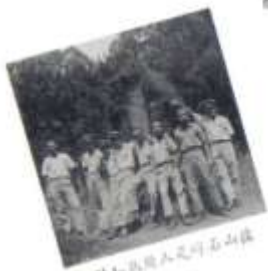
的知能人及師石山德