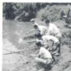
上 下 地 草 叶