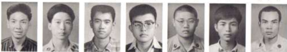
新入由 雲勤唐 剛之尤 福強羅 志明麻 孫紀羅 春月羅