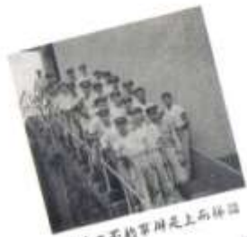
門法二不的軍用是上而排四