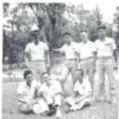
開家以實進人志學