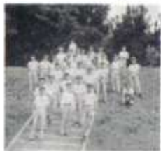
山 登 次 登