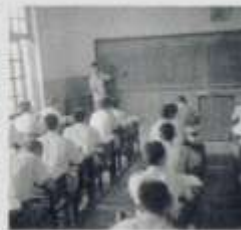
何應於於講高器器