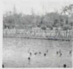
約瓦村製汗亭上帳