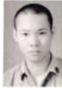
潘 標 黃